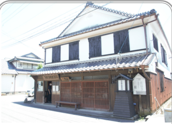
松合郷土資料館（旧鈴木家） 宇城市不知火町松合