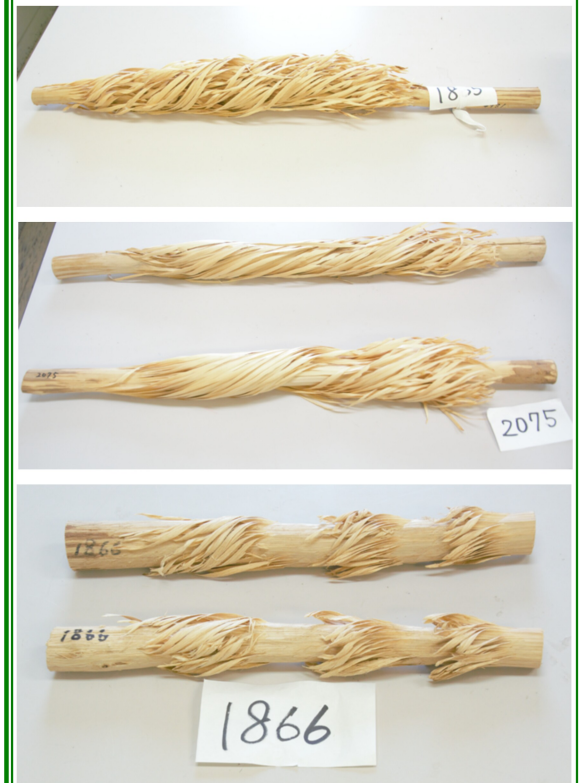
図1 ナレナレ木(5点) (天草市立本渡歴史民俗資料館所蔵)