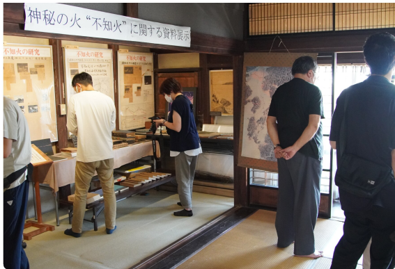
館内を取材するスタッフ