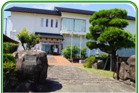
天草市立本渡歴史資料館

9:00 松海苑を出発、R266を西進して最初の目的地である「天草市立本渡歴史民俗資料