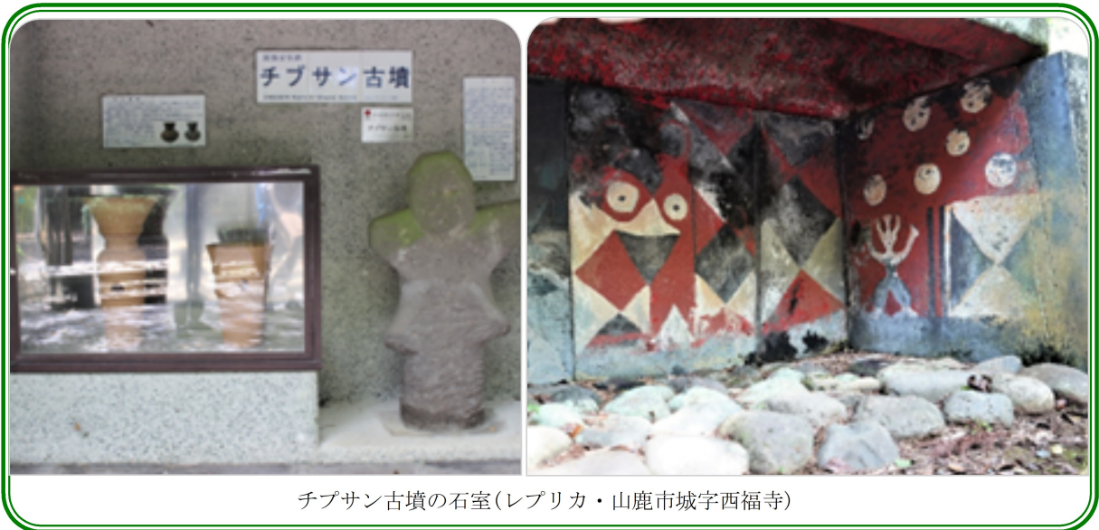
チブサン古墳の石室(レプリカ・山鹿市城字西福寺)