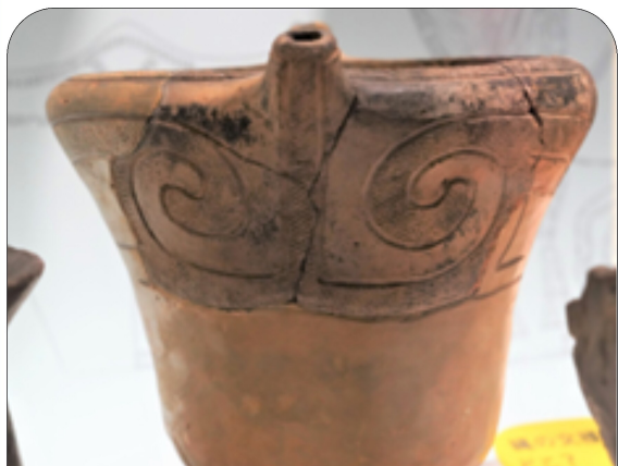
図5 縄文土器(中津式土器)他 (市立熊本博物館収蔵)