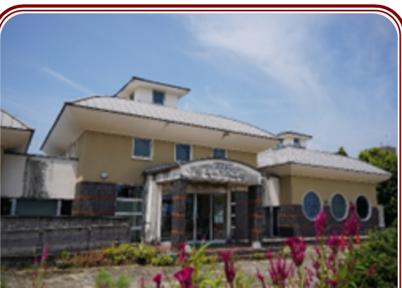
霧島市立隼人塚史跡館（霧島市隼人町）