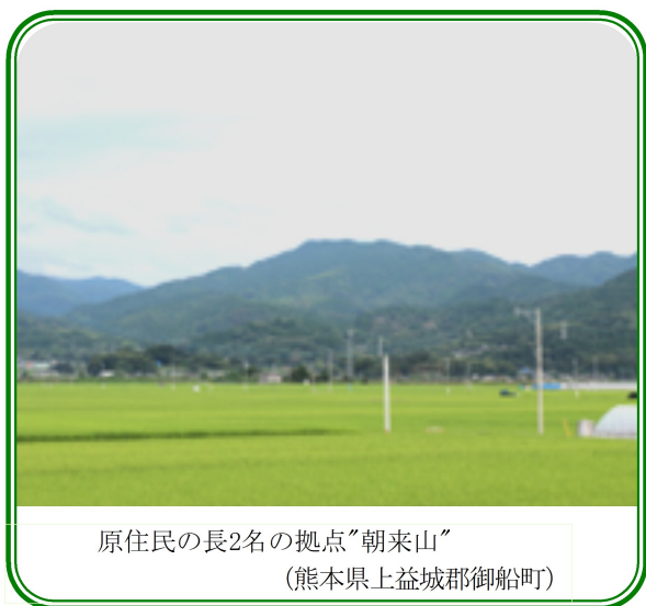
原住民の長2名の拠点“朝来山” (熊本県上益城郡御船町)

居城が置かれた朝来山を撮影。 事前調査によると「鬼の窟古墳」は朝来山の中腹であるという。 かなり狭い山道を車で登る。 山道の右側はガードレールもない崖、運転に細心の注意を払う。