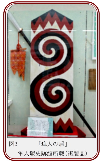
図3 「隼人の盾」 隼人塚史跡館所蔵(複製品)

だが、解説には、この「隼人の盾」としての紋様は魔除けの意味をもつとされ、天皇の守護において「隼人の盾」を呪術的な物として