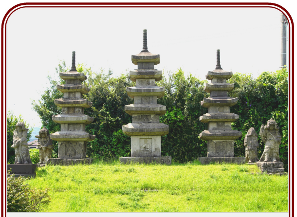
図4 国指定史跡隼人塚