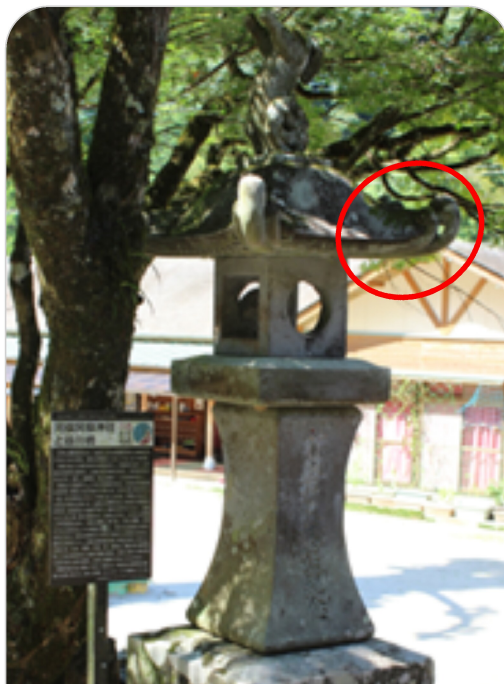
石灯籠の笠の四隅に刻まれたワラビテ文様