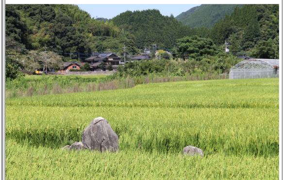
水田に鎮座する伝承の岩