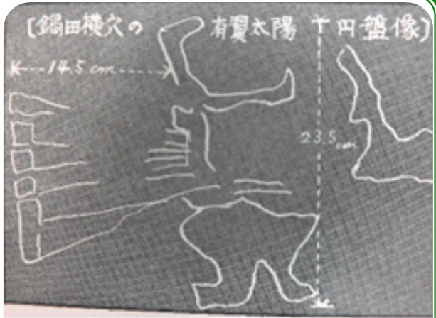
有翼太陽円盤のイラスト