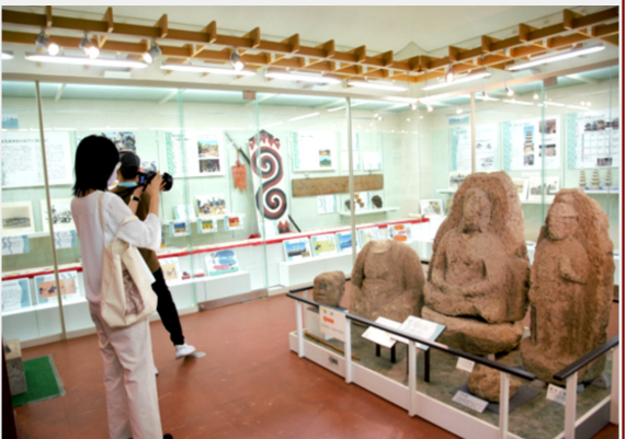
館内を取材するスタッフ