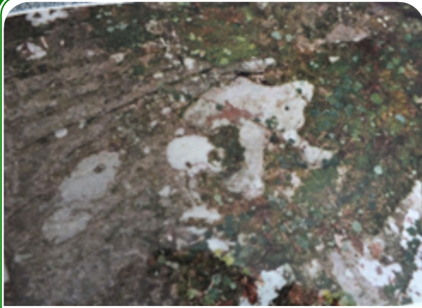
鍋田横穴入口の右上部に刻まれた有翼太陽円盤像(1997年撮影)