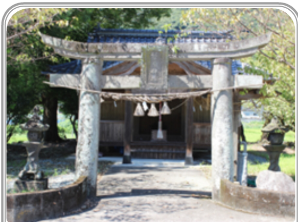
菅原神社（八代市東陽町北畑中）