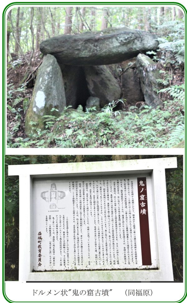
ドルメン状“鬼の窟古墳” (同福原)

アイヌの空壕は敵からの侵入に備えた設備で、もし空壕であるならヤマトとの戦闘に供えて