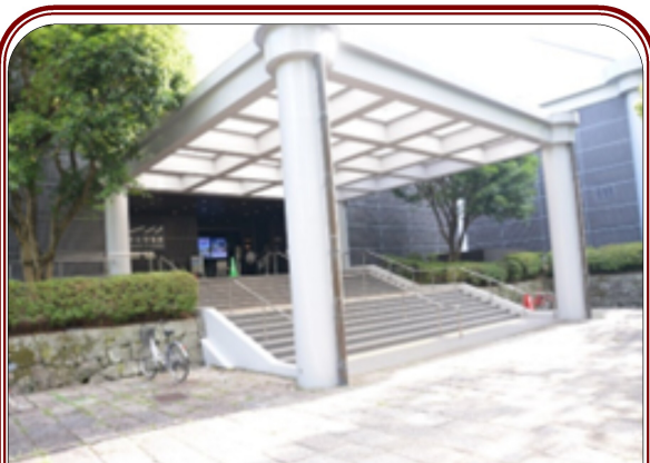
市立熊本博物館(熊本市中央区古京町)

益城熊本空港ICを下り、一般道で市中心部の熊本城公園に併設された同博物館へ向かう。