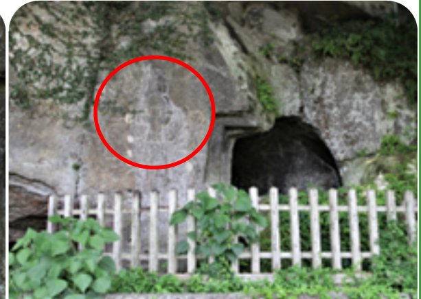
27号の横穴側面に装飾された「人物、弓、鞆、盾ほか」

この彫刻が後世の人々への古代人の重要なメッセージであるということを感じて鍋田横穴群を後にした。