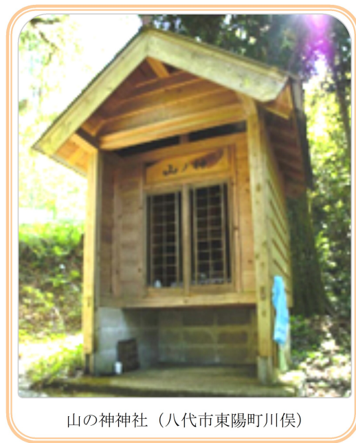
山の神神社 (八代市東陽町川俣)