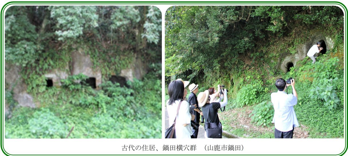
古代の住居、鍋田横穴群 (山鹿市鍋田)

博物館や歴史史料館での雰囲気とは違い、まるで古代にタイムスリップしたかのような錯覚にとらわれた不思議な体験であった。